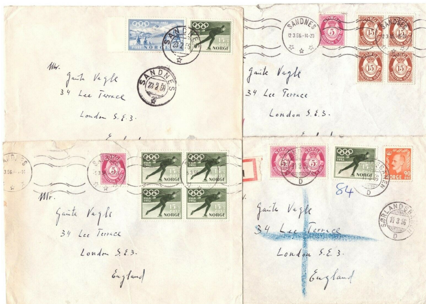
Illustrasjonen av loten med de fire brevene.

Objektet jeg her vil skrive noen linjer om var en lot på fire brev hvor et av dem hadde en firerblokk av et av Olympiadeprimerkene. En ganske enkel beskrivelse ledsaget av et bilde av de fire brevene. Det som fanget min interesse, var brevet nede til høyre med det blå krysset. Det er slik rekommanderte brev til England blir merket ved ankomstbehandling av det engelske postvesen. Da jeg forstørret det ellers litt uklare bildet viste det seg at brevet var stemplet SØRLANDSBANEN D i 1956. Da var nysgjerrigheten stor om dette var et REK-brev, innlevert på toget, eller om det var levert på et annet postkontor og bare stemplet på toget. Hvis det var et REK-brev fra postekspedisjonen på toget, er det en meget uvanlig forsendelse.