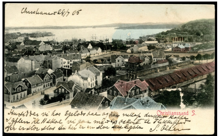
Postkort brukt i 1905 som viser området Gartnerløkka og Banehaven sett fra Baneheia

Postkortmotivet denne gang er for øyeblikket gjenstand for stor debatt. Ved siden av Kornsiloen på Odderøya var nok de nye planene for Gartnerløkka-området det som vekket størst engasjement.