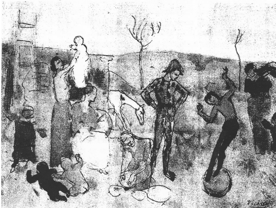
Picasso: «Gjøglerne», også kalt «Sirkusfamilien», koldnålradering 1905, hvor stempelets motiv er hentet fra.

Magne Nodeland laget utkastet til stemplet som fikk en noe endret endelig utforming hos stempelgravøren.