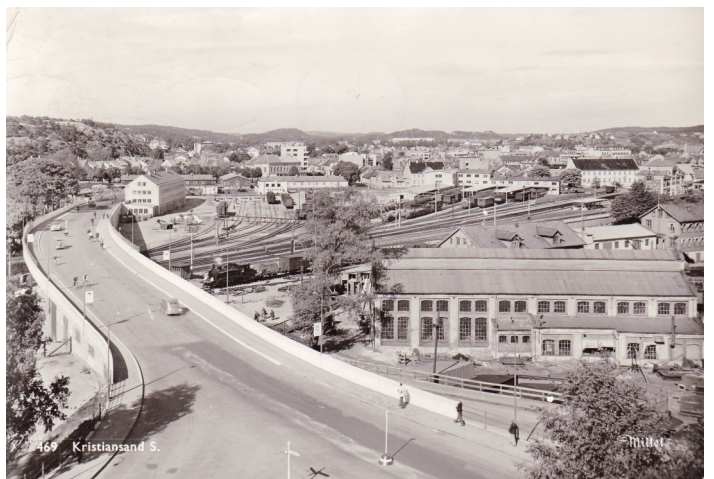
Postkort ubrukt i 1938 som viser Garnerløkka og jernbanebroa sett fra arkivet på Vesterveien

Men hva er nå egentlig Gartnerløkka? Gartnerløkka er et tungt trafikkert område i Kristiansand sentrum. Her møtes E 18, E 39 og riksvei 9. I tillegg kommer trafikken til og fra danskeferja, samt en stor del av trafikken inn og ut fra Kvadraturen. Gartnerløkka-prosjektet skal løse opp trafikkproblemene i området både for myke og harde trafikanter og er kostnadsberegnet til rundt 3 milliarder kroner. Dette skal finansieres som et spleiselag mellom brukerne og staten. Alle synes enige om at noe må gjøres med Gartnerløkka, men spørsmålet er bare hva? Debatten går nå videre med nye politikere og valgløfter som skal forsøkes oppfylt.