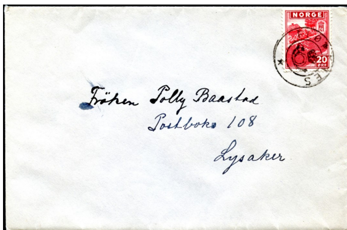
Illustrasjonen av brevet stemplet KPH FLØRENES

1968. Norgeskatalogen Postal II operer med en sjeldenhetsgradering på 7 punkter for stemplet.