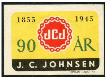
Merkat utgitt i anledning 90-års jubileet.