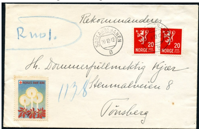
REK-brevet fra SØRLANDSBANEN B i 1942

Jeg sendte etterhvert et godt bud på lotten, selv om jeg egentlig bare var interessert i det ene brevet. Heldigvis fikk jeg tilslaget. Gleden var stor da brevene ankom og det viste seg at REK-brevet var sendt med Sørlandsbanen fra Sandnes og var utstyrt med blanko REK-etikett med løpenummer 0001. SØRLANDSBANEN D stemplet ble brukt i perioden 1943 til 1960 på strekningen Kristiansand S – Stavanger.