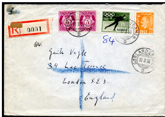
REK-brevet fra SØRLANDSBANEN D i 1956