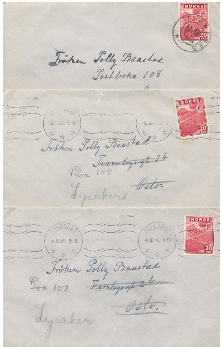
Illustrasjon av korrespondansen fra høsten 1945

Opplysningene i Digitalt museum er villedende, da stemplet KRONET POSTHORN FLØRENES som nevnt ble flyttet til Lillesand postkontor oktober 1945, men trolig ble ikke avtale om drift av "brevhuset" avsluttet før i 1968. Eventuelle brev eller frimerker stemplet kronet posthorn FLØRENES etter oktober 1945 må betraktes som "etterstempling", men jeg er ikke kjent med noen slike.»