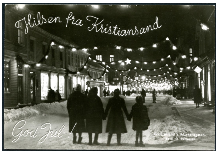
God Jul postkort med kjent motiv.