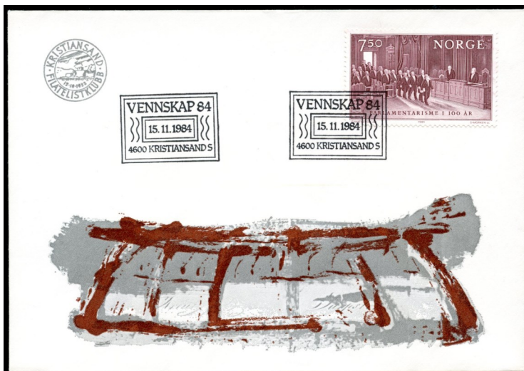
Særstempel og konvolutt til den regionale utstillingen «VENNSKAP 84» designet av Kjell Nupen.

av møtene våre. Selv fortalte han at han gjerne gikk på markeder i større byer, helst i utlandet, for å finne egnet materiale, både brev og postkort, til disse kunstverkene. Han mente, med rette, at han på denne måten ga postale objekter et forlenget liv.