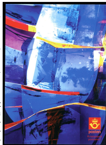
Omslag til lokalt frimerkehefte utgitt 22. april 2005 av Kristiansand Filatelistklubb. Motiv av Kjell Nupen «Fra Mørke mot lys» (2004) Detalj fra glassmaleri i Søm kirke.