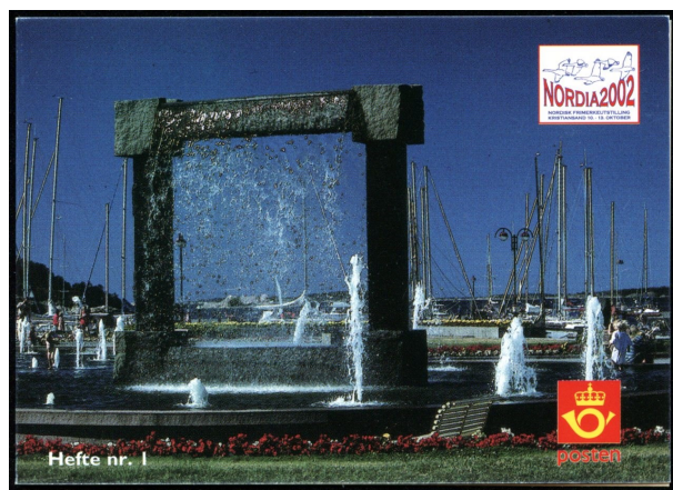
Omslag til lokalhefte utgitt av Kristiansand Filatelistklubb utgitt i september 2000. Motivet er av Kjell Nupens fonteneskulptur i Otterdalsparken som bare kalles Nupen-parken.

At et bilde av Kjell Nupen pryder et av de første frimerkene med moderne kunst Posten ga ut, sier litt om hans utrolige posisjon innen norsk og nordisk kunst.