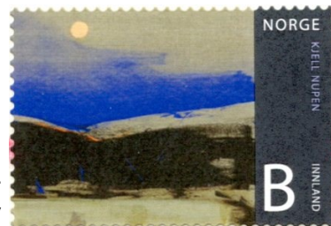
NK 1706 utgitt 2. januar 2009 med motiv «Sommer natt til E.M.» (utsnitt) av Kjell Nupen

I forbindelse med Kjell Nupens bortgang har vi lyst å trekke frem noen minner vi har om ham i KFK. Det er sikkert langt fra alle nåværende medlemmer som vet at han var med i klubben, fra høsten 1983 til 1995. Selv sa han at det var et helt naturlig medlemskap. Han var generelt interessert i frimerker som samleobjekter, men også i det trykktekniske ved produksjonen og hva som forårsaket så store variasjoner i resultatet.